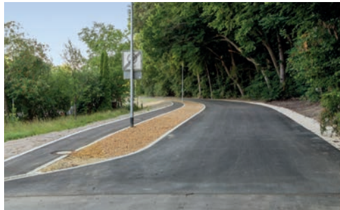
Links: Zufahrt über Anwaltinger Weg. Rechts: Brücke, Einfahrt über St. 2381

Ein weiterer Auftrag für eine Lärm-schutzwand inkl. Bepflanzung ist vergeben und so wird diese im Sommer/Herbst erstellt. Mit der