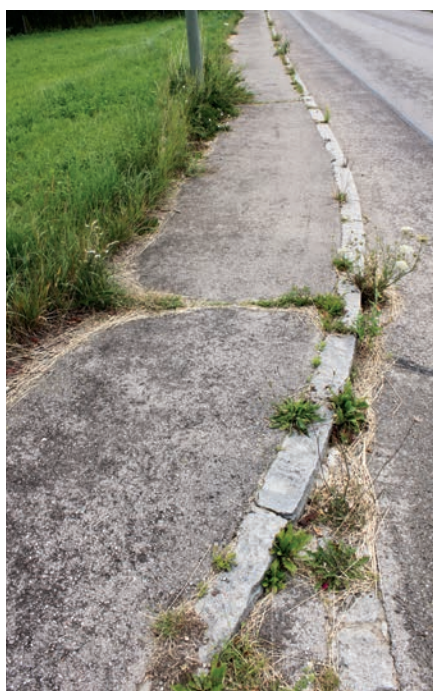
Beispiel für ungepflegten Gehweg

Diese finden Sie auf der Homepage der Gemeinde Affing unter www.affing.de/ortsrecht