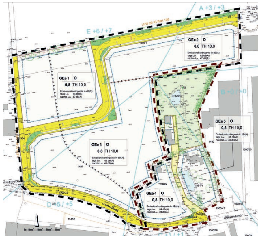
Entwurf Bebauungsplan in der Fassung vom 03.05.2022, Brugger Landschaftsarchitekten

„Gewerbegebiet nördlich des Unterkreuthweges“ in der Fassung vom 23.02.2021 gebilligt.