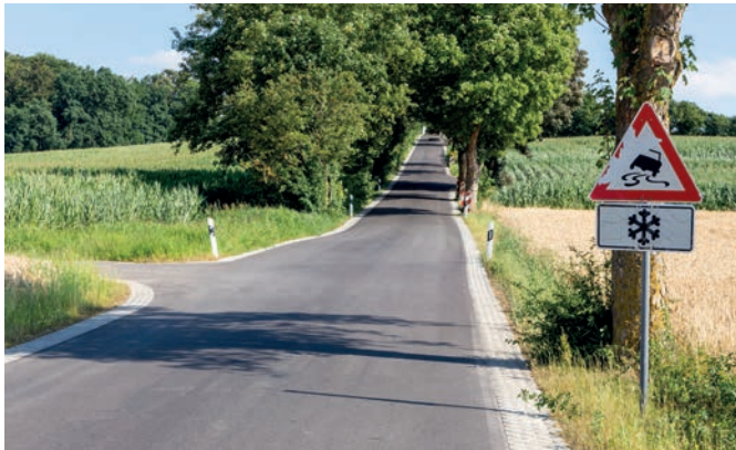
Miederinger Berg aus Richtung Aulzhausen

sengittersteinen vollflächig auf Beton verlegt und vergossen, flankiert.