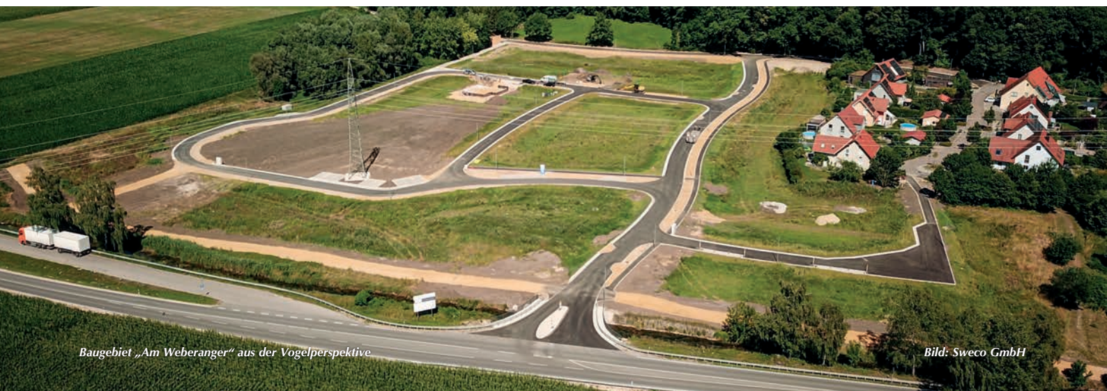
Baugebiet „Am Weberanger“ aus der Vogelperspektive

konnte mit dem Auffüllen der neuen Straßen begonnen werden. Die Traktoren liefen einige Wochen und transportierten so ca. 14.000 Tonnen Sandmaterial ins Baugebiet. Über den Sommer 2021 konnten dann die Wasserleitung sowie der neue Kanal verbaut werden. Der relativ kurze Winter unterstützte die Baufirma dabei,